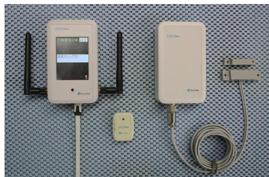
写真の受信機は乾電池タイプです。

関連製品：COCOima-Detect、COCOima-Hunt、COCOima-モバイル、COCOima-Gatekeeper、COCOima-Sagas、COCOima-Constructionシリーズ